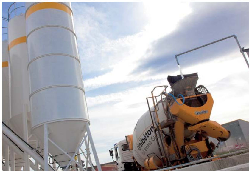
▲ Lavage camion toupie.