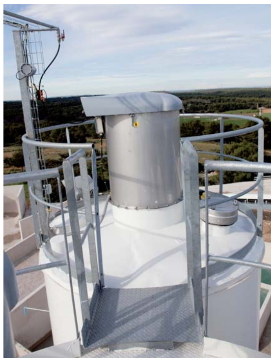
▲ Silos à ciment avec filtre de sécurité.